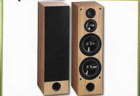
ACOUSTIQUE QUALITY WEGA 55 MKIII