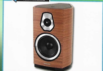
SONUS FABER SONETTO II WOOD