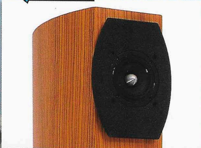
AUDIUM COMP 5.2 DRIVE